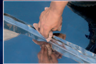
Arbeitsvorbereitung, Reinigung der Aufkantung.