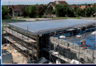
Einrüstung des Gebäudes.