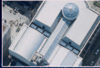
Stadthaus N1, Mannheim.