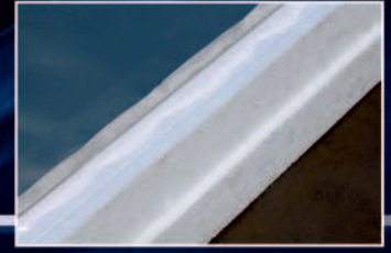
Dachaufbau, Dampfsperre, Wärmedämmung Edelstahl.