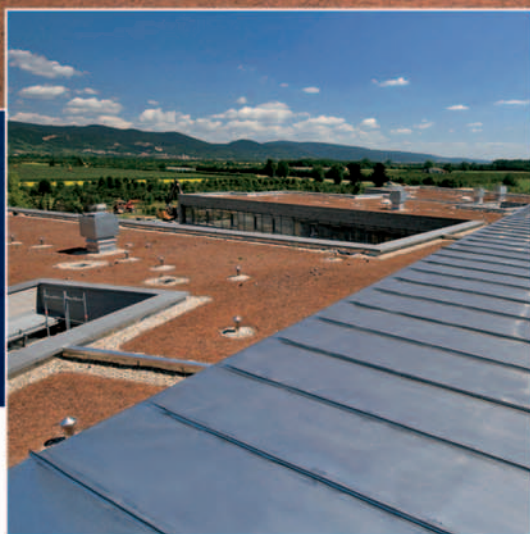
Flachdacheindeckung mit angehender Begrünung in Kombination mit Bekiesung und sichtbarem Edelstahl.

Rollnahtgeschweißte Flachdächer aus Edelstahl können je nach Wunsch bekiest begrünt oder als reine Flachdachabdeckung gefertigt werden.