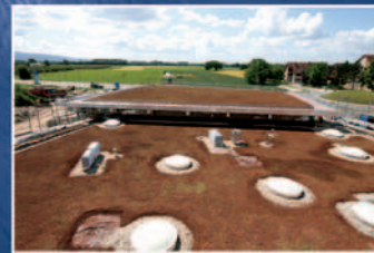
Fertiggestelltes Flachdach mit angehender Begrünung.