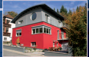
Und vieles mehr.