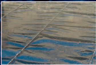
Dichtigkeitsprüfung mit Wasser.